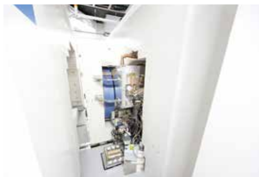
サイクロトロン本体