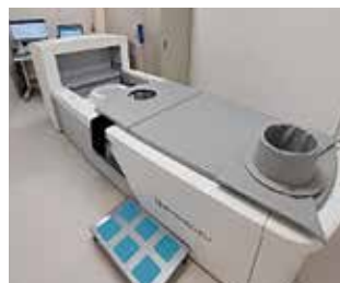
BresTome(頭部・乳房用PET装置)

核医学検査に使用される装置は、検査目的臓器に集積する薬品に放射性同位元素を付けた「放射性医薬品」を使用して放出された放射線を測定します。これにより、検査目的臓器の機能が画像化されます。核医学で得られる画像は解剖学的位置がハッキリしませんが、CT画像と重ね合わせる事で位置情報を高める事ができます。CT画像と重ね合わせることで出来る装置が「SPECT・CT複合機」、「PET・CT複合機」になります。当院ではこの装置をそれぞれ2台有しております。その他に、当院では脳のSPECT検査を検出感度の高い3検出器SPECT装置で主に行っております。頭部・乳房用PET装置が昨年導入され、痛みの無い乳房検査を提供しております。