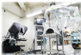
ダヴィンチトレーニングセンター

見学内容：① 救命救急センター ② ダヴィンチトレーニングセンター ③ 回復期リハビリテーション病棟 (内容は変更になる場合があります)