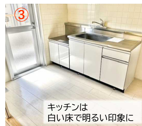
キッチン 白い床で明るい印象に