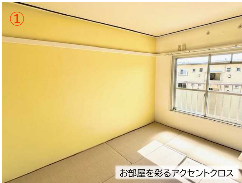
お部屋を彩るアクセントクロス

※ 住戸によって、アクセントクロスの色や間取りは異なります。 ※ その他の設備等は、U35のお部屋紹介をご参照ください。