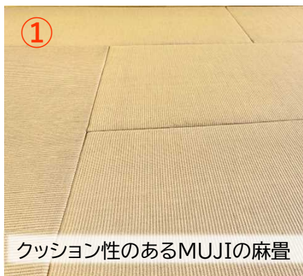
クッション性のあるMUJIの麻畳