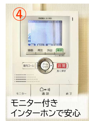
モニター付き インターホンで安心