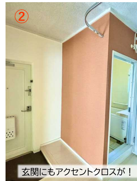
玄関にもアクセントクロスが！